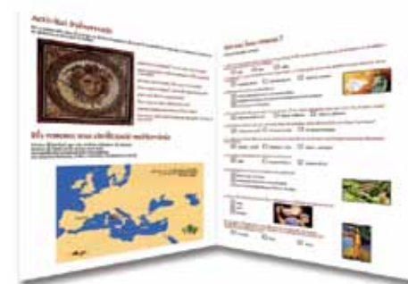
Dossier per alumnes de primària