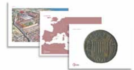
Material gràfic de suport al guia durant la visita

vineatarraco.blogspot.com/ venatarraco.blogspot.com/